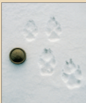
Spårstämplar efter två vargar. Bakfotsstämplarna överst och därunder framfotsstämplarna.