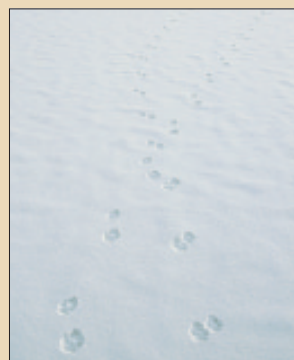
Spårlöpor efter två vargar