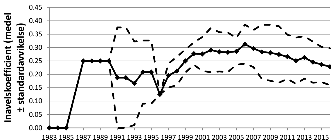
Figur 2. Den genomsnittliga inavelskoefficienten i familjegrupper för åren 1983 till 2016.