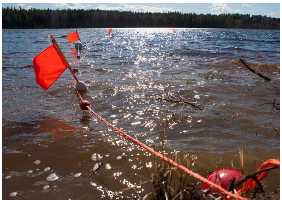
Utförandet av ett vattenlapptyg är i grunden detsamma som för ett konventionellt lapptyg, men monteras på flytlina och bojar istället för på pinnar och träd. I Sverige används lapptyg på vatten i ett mindre antal färbesättningar.

Effekten av ett vattenlapptyg är förmodligen större ju tätare flaggorna sitter. Ett tätt lapptyg är dock både dyrare och svårare att lägga ut och ta upp (höst och vår) samt passera med båt. I ett försök att balansera för- och nackdelar har vi valt att sätta flytbojar med flaggor var tionde meter. Vattenlapptyget bör placeras åtminstone 20 meter ut i vattnet, så att inte vargar (eller andra rovdjur) kan gå runt det i strandkanten. För att hålla det på plats behövs ankare som fästs i lapptyget med rep. Antalet ankare som behövs beror framförallt på hur långt lapp-