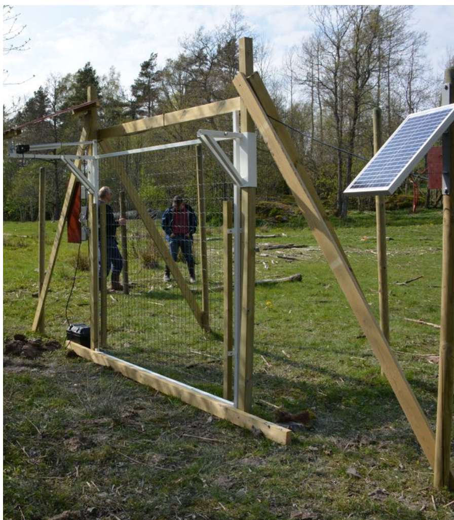
Automatisk grind.