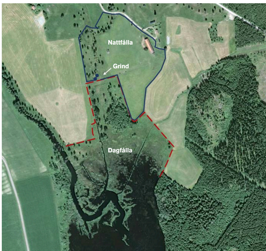
Figur 2. Exempel på bete där en hage som avgränsas av vatten används endast på dagen.