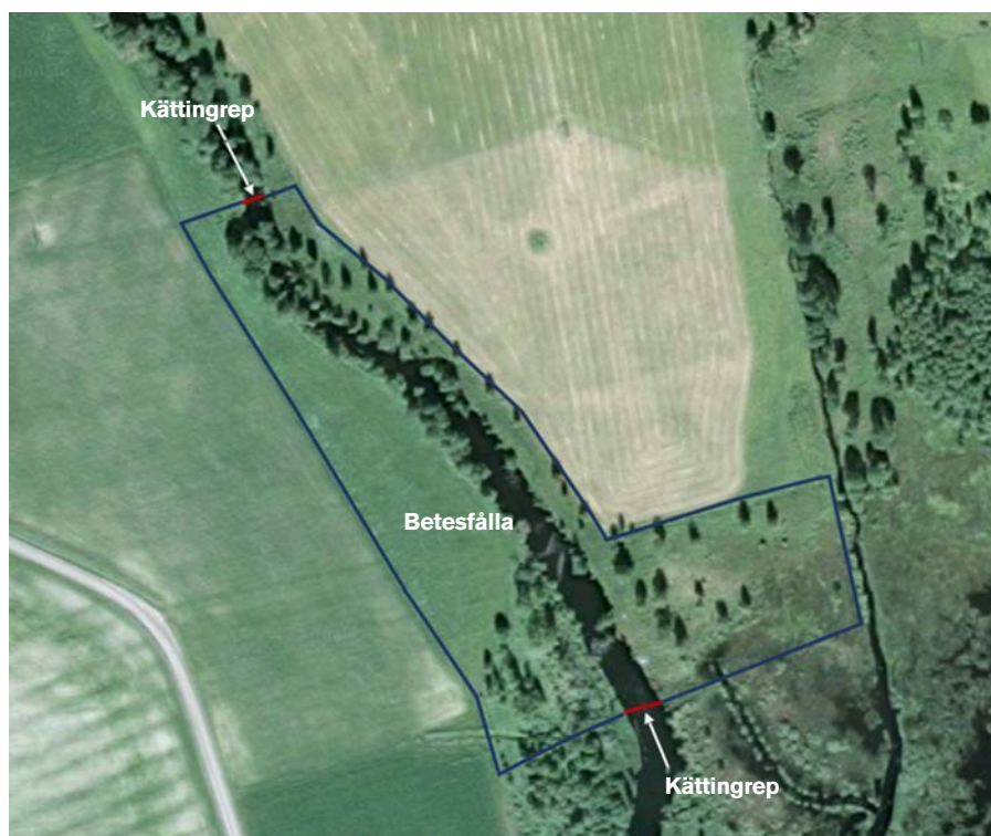
Figur 3. Exempel på bete där kättingrep har spänts över ett vattendrag som genomkorsar en beteshage.

Beteshagar som genomkorsas av ett vattendrag har svaga punkter där vattendraget rinner in i och ut ur hagen. Att sätta stängsel över vattnet är ofta besvärligt med tanke på att vattenståndet varierar och att is och annat kan fastna i stängslet och dra det med sig. En smidigare lösning är att spänna ett rep eller en vajer över vattendraget och förse det med kättingar av metall eller plast som hänger ned mot vattnet. Vi antar att ett sådant kättingrep fungerar på samma sätt som lapptyg och utgör ett mentalt hinder för rovdjur som rör sig längs strandkanten eller i vattnet. Vi har testat kättingrep över rinnande vattendrag under fem år och kan konstatera att de står emot såväl vårflooder som höstregn. Figur 3.